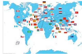
Infos par pays, fiches pratiques, offres d'emploi internationales